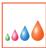
Piezo a goccia variabile