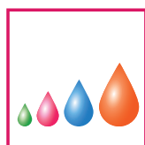
Piezo goccia variabile